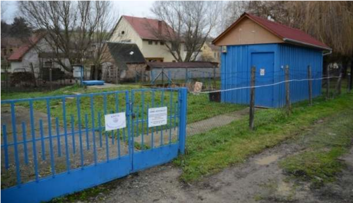
Bószénfai vízmű a korszerűsítés előtt

A társulás a közbeszerzési eljárás során nyertesnek nyilvánított, a Wolfbau Team Építőipari és Kereskedelmi Kft. és a Vattenteknik Hungary Kft. alkotta WV 2014 - Surján Völgy Konzorciummal kötötte meg a kivitelezésre szóló szerződést.